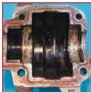
Carter moteur après 500 h