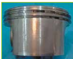
Piston moteur après 500 h