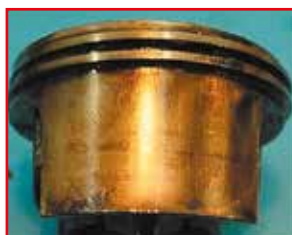
Piston moteur après 500 h

«L'utilisation de bougies non appropriées pour nos moteurs peut causer des dommages au système électronique voire au moteur et dans certain cas provoquer un risque d'incendie de la machine. Il est donc primordial de respecter nos préconisations»