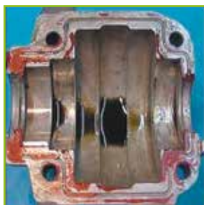
Carter moteur après 500 h